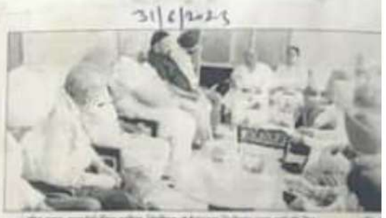
नेहरू कालेज मालवा में ओरछ स्टूडेंट्स एसोसिएशन की बैठक मौके विद्यार्थी चर्चा करते हुए सादर्य।

नेहरू कालेज की बेहतरी के लिए हर संभव प्रयास जुटाएंगे।