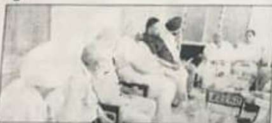
नेहरू कालेज मालवा में ओरछ स्टूडेंट्स एसोसिएशन की बैठक मौके विद्यार्थी चर्चा करते हुए सादर्य।

समूह, 30 वर्ष (संस्कृत विद्यालय) के शिक्षक संघों के बीच एक बैठक हुई। इस बैठक में नेहरू कालेज की बेहतरी के लिए हर संभव प्रयास जुटाएंगे।